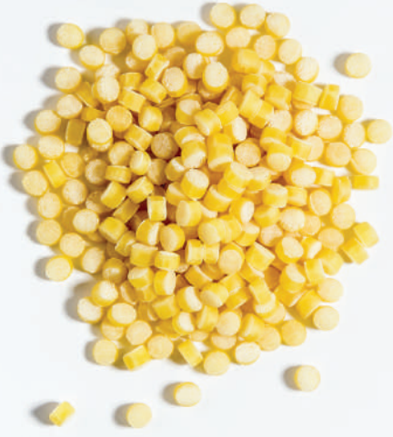
128 KUSKUS COUSCOUS