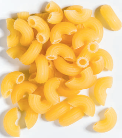
126 ORTA DİRSEK MINI ELBOW