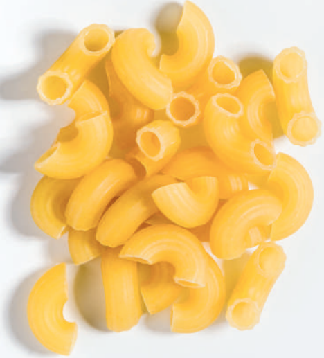
125 BÜYÜK DİRSEK BIG ELBOW