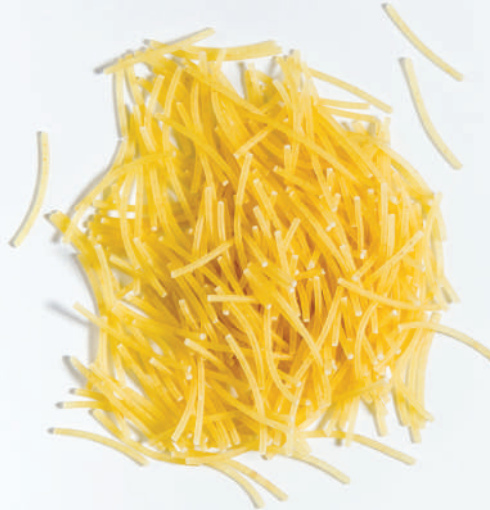
156 İNCE TEL ŞEHRİYE THIN VERMICELLI