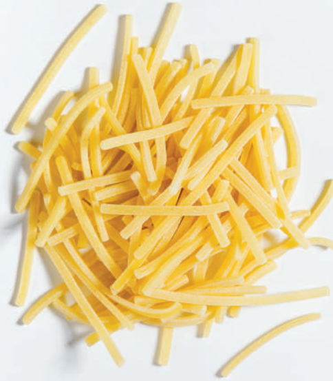
132 ÖZEL İNCE ERİŞTE SPECIAL THIN TAGLIATELLE