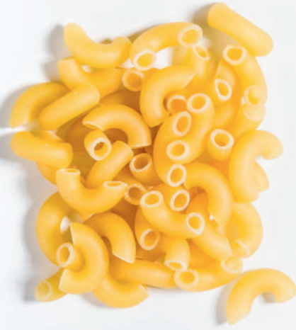
137 TIRTIKSIZ DİRSEK ELBOW WITHOUT LINE