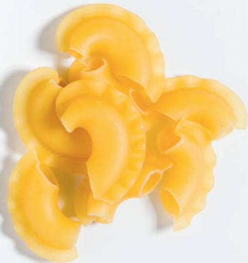
107 TAÇ CROWN