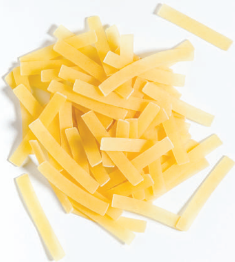
117 ERİŞTE TAGLIATELLE