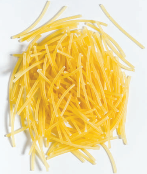
131 UZUN TEL ŞEHRİYE LONG VERMICELLI (EXTRA THIN)