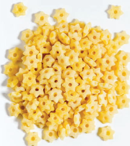
129 YILDIZ ŞEHİRİYE STAR