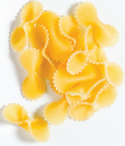
108 FİYONK TRIPOLINI