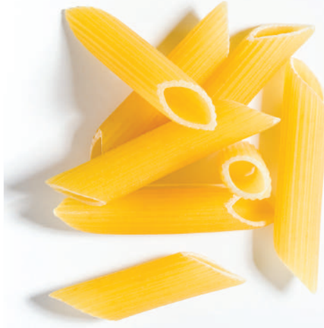
113 PENNE RİGATE PENNE RIGATE