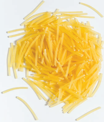
118 TEL ŞEHRİYE VERMICELLI