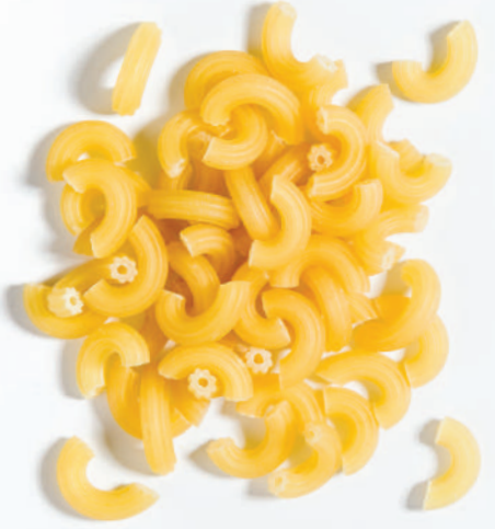
109 DİRSEK (C MAKARNA) C MACARONI (GRAMIGNA)