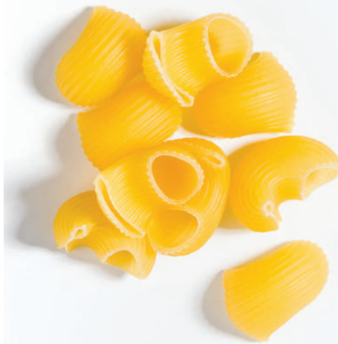
106 MANTI LUMACONİ RİGATİ