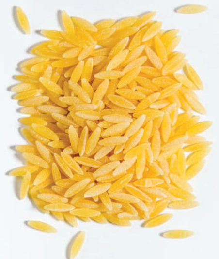
119 ARPA ŞEHİRİYE RISONE