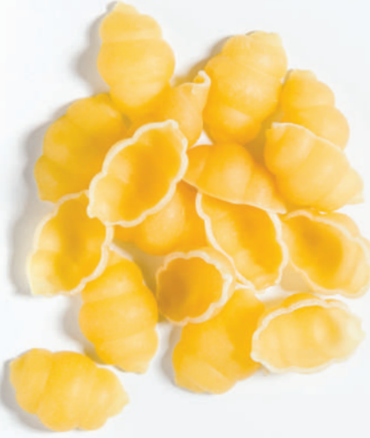
124 BELLİNİ GNOCCHI