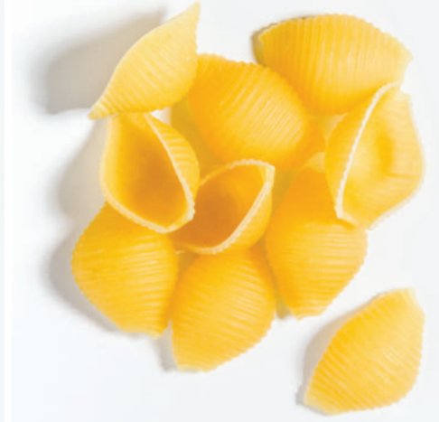
143 ÇİZGİLİ BÜYÜK MİDYE BIG SHELL WITH LINE