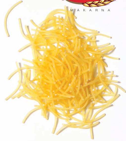
161 KIVRIK TEL ŞEHRİYE CURVED VERMICELLI