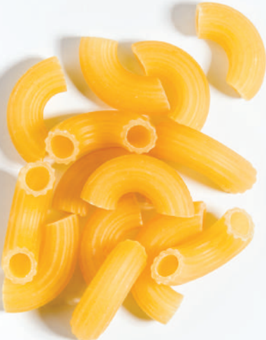
155 GENİŞ DİRSEK WIDE ELBOW