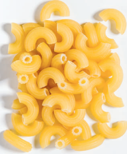
123 KÜÇÜK DİRSEK SMALL ELBOW