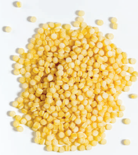
144 KÜÇÜK KUSKUS SMALL COUSCOUS