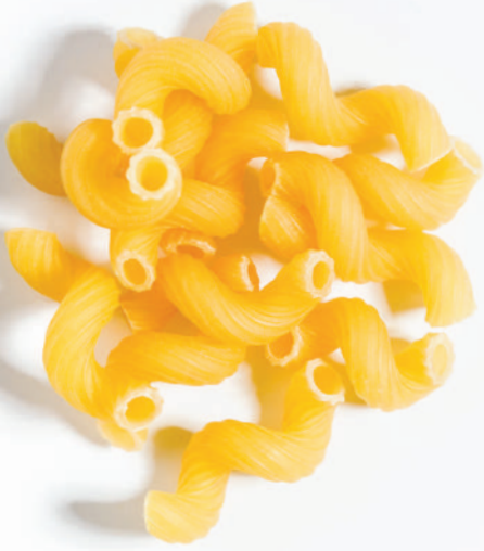
105 ÇARLISTON CAVATAPPI