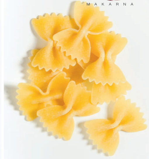
130 KELEBEK FARFALLE