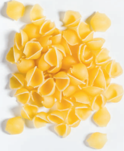
121 MİDYE PERLİNİ