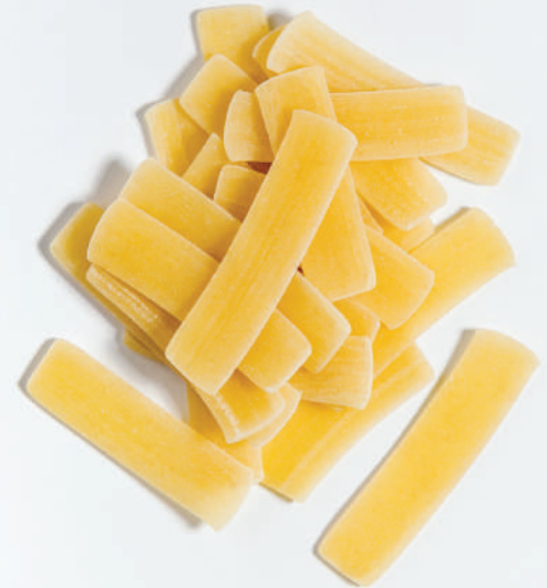
133 GENİŞ ERİŞTE SPECIAL WIDE TAGLIATELLE